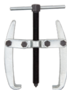
Extractor de dos garras con autocentrado, 40 × 60 702-40-1