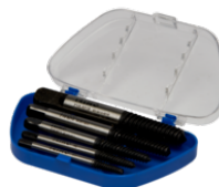
Juego de extractores de espárrago, 5 piezas, M3-M18 716-5-1