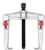
Extractor universal con dos garras y ajuste rápido, 90 × 100 mm 701-90-1