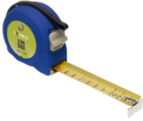
Cinta métrica, 3 m × 16 mm 980-3-1