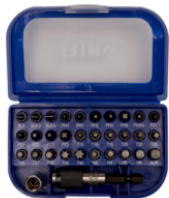
Juego de puntas de 1/4" con adaptador, vaso y portapuntas 475-32-1