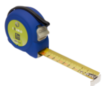
Cinta métrica, 3 m × 16 mm 980-3-1