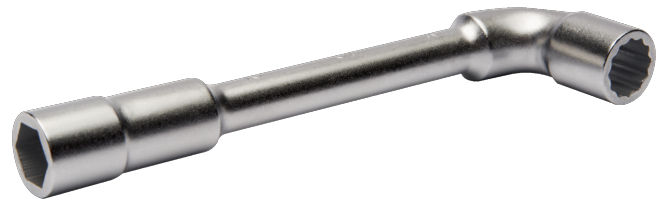
51-13-1 Doppelsteckschlüssel, 13 mm