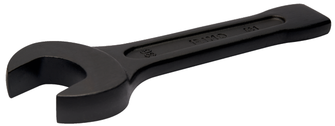
31-70-2 Schlag-Maulschlüssel, 70 mm