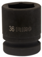
1" Kraft-Steckschlüssel-Einsätze, Sechskant, 33 mm 177-33-2