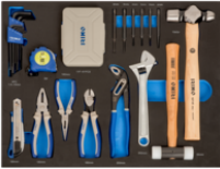
3/3-Schaumstoffeinlagen Schlagwerkzeuge, Zangen und Bits, 85-teilig IFF1A002