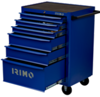
26"-Werkstattwagen mit 6 Schubladen 9066K6