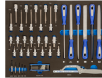
3/3-Schaumstoffeinlagen Steckschlüsseinsatz-Bits, Feilen und Schneidwerkzeuge, 44-teilig IFF1A007