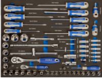
3/3-Schaumstoffeinlagen Steckschlüsseinsätze und Schraubendreher, 60-teilig IFF1A004