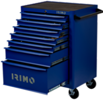
26"-Werkstattwagen mit 7 Schubladen 9066K7