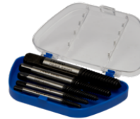
Schraubenausdreher-Satz, 5 teilig, M3-M18 716-5-1