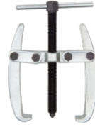
Selbstzentrierender zweiarmiger Abzieher 40x60 702-40-1