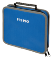
Werkzeugmappe, leer, mit Gummibandschlaufen für die Aufnahme von 18 Werkzeugen 9022-4-26