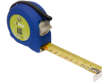
Cinta métrica, 3 m x 16 mm 980-3-1