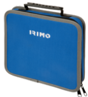
Bolsa plegable vacío para herramientas con tiras para 18 herramientas 9022-4-26