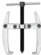
Extractor de dos garras con autocentrado, 40 × 60 702-40-1