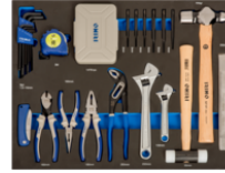
Herramientas de golpeo, alicates y puntas en foam 3/3 (87 piezas) IFF1A005