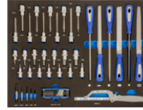
Puntas de vasos, limas y herramientas de corte en foam 3/3 (44 piezas) IFF1A007