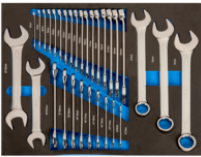
Llaves combinadas y llaves fijas en foam 3/3 (31 piezas) IFF1A006