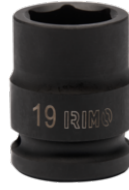
Vaso de impacto hexagonal de 1/2", 19 mm 167-19-1