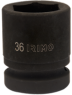
Douille à chocs 1" 6 pans 30 mm 177-30-2