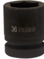
Douille à chocs 1" 6 pans 32 mm 177-32-2