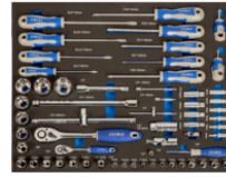
Mousse 3/3 Douilles, tournevis - 60 pcs IFF1A004