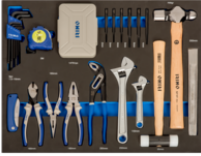
Mousse 3/3 Outils de frappe, pinces et embouts - 87 pcs IFF1A005