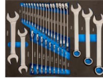
Mousse 3/3 Clés mixtes et clés à fourche doubles - 31 pcs IFF1A006