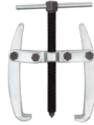
Extracteur à 2 griffes avec système d'auto-centrage 40x60 702-40-1