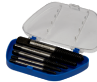
Jeu de 5 extracteurs de goujons, M3- M18 716-5-1