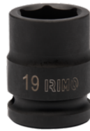
Bussola a macchina 1/2" esagonale 19 mm 167-19-1