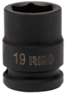
Assortimento bussole a macchina 1/2" esagonale 12 mm 167-12-1