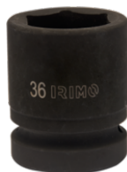
Bussola a macchina 1" esagonale 32 mm 177-32-2