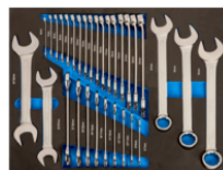
Chiavi combinate e a forchetta in alloggiamento termoformato 3/3, 31 pezzi IFF1A006