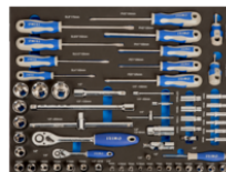
Chiavi a bussola e cacciavite in alloggiamento termoformato 3/3, 60 pezzi IFF1A004