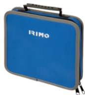
Portautensili vuoto con elastici per 18 utensili 9022-4-26