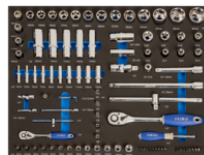
Chiavi a bussola e inserti in alloggiamento termoformato 3/3, 94 pezzi IFF1A001