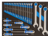
Chiavi combinate e cacciavite in alloggiamento termoformato 3/3, 27 pezzi IFF1A003