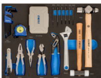
Utensili a battere, pinze e inserti in alloggiamento termoformato 3/3, 85 pezzi IFF1A002