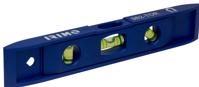
982-TOR-1 Nivel torpedo magnético, 230 mm