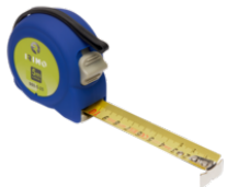
Cinta métrica, 5 m x 19 mm 980-5-1