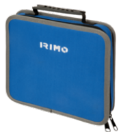
Bolsa plegable vacío para herramientas con tiras para 18 herramientas 9022-4-26