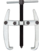
Extractor de dos garras con autocentrado, 40 × 60 702-40-1