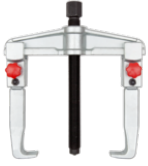
Extractor universal con dos garras y ajuste rápido, 90 × 100 mm 701-90-1