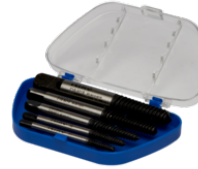
Juego de extractores de espárrago, 5 piezas, M3-M18 716-5-1