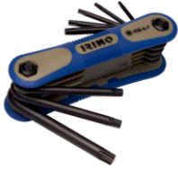
Llaves acodadas Torx hexagonales en estuche, 8 piezas, T9-T40 458-8-F