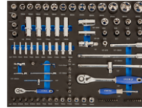
Inserções de espuma 3/3 com chaves de caixa e pontas - 94 pcs IFF1A001