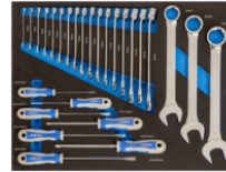
Inserções de espuma 3/3 com chaves de bocas combinadas e chaves de parafusos - 27 pcs IFF1A003