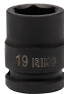
Ударная шестигранная головка 1/2", 19 мм 167-19-1