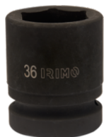
Ударная шестигранная головка 1", 30 мм 177-30-2