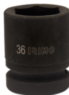
Ударная шестигранная головка 1", 32 мм 177-32-2