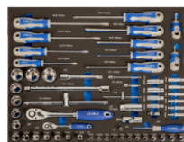
Поролоновые вставки 3/3 с торцевыми головками и отвёртками, 60 шт. IFF1A004