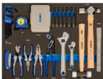
Поролоновая вставка 3/3 для ударного инструмента, плоскогубцев и бит, 87 шт. IFF1A005