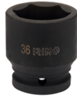
Ударная шестигранная головка 3/4", 30 мм 173-30-2