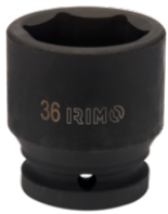
Ударная шестигранная головка 3/4", 32 мм 173-32-2