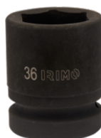
Ударная шестигранная головка 1", 32 мм 177-32-2