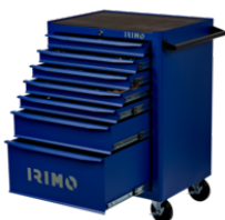
Инструментальная тележка 26", 7 выдвижных ящиков 9066K7