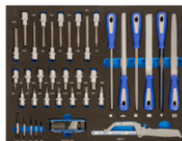
Поролоновая вставка 3/3 с набором головок, бит, напильников и режущих инструментов, 44 шт. IFF1A007