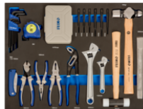
Поролоновая вставка 3/3 для ударного инструмента, плоскогубцев и бит, 87 шт. IFF1A005