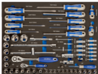
Поролоновые вставки 3/3 с торцевыми головками и отвёртками, 60 шт. IFF1A004