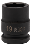
Ударная шестигранная головка 1/2", 17 мм 167-17-1