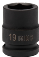
Ударная шестигранная головка 1/2", 19 мм 167-19-1