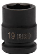
Ударная шестигранная головка 1/2", 27 мм 167-27-1