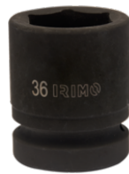
Sexkantskrafthylsa 1", 27 mm 177-27-2