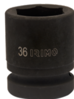
Sexkantskrafthylsa 1", 32 mm 177-32-2