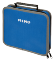
Verktysportfölj med resårband i både lock och botten 9022-4-26